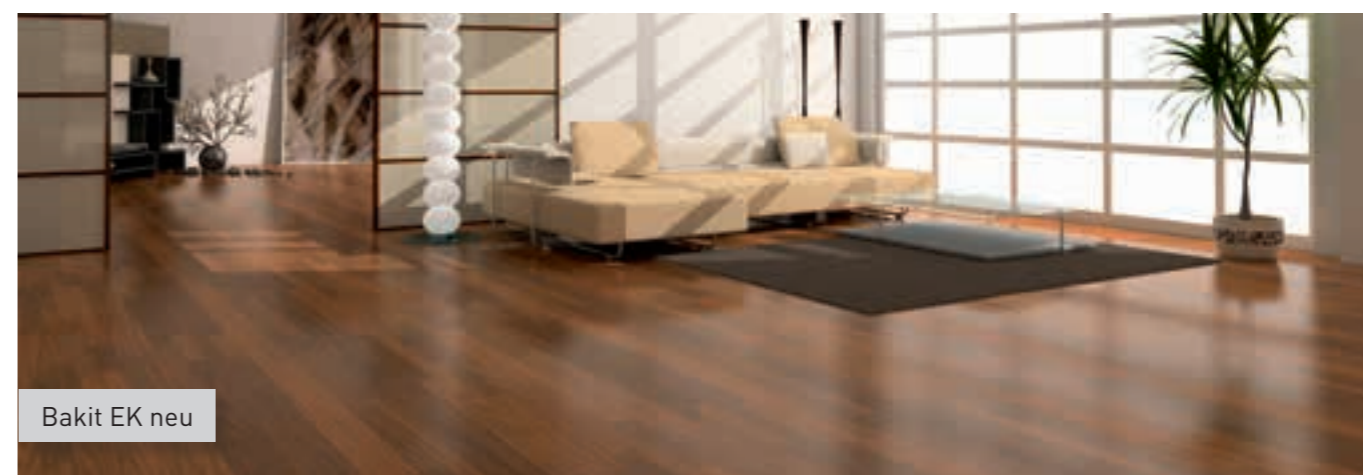
Bakit EK neu