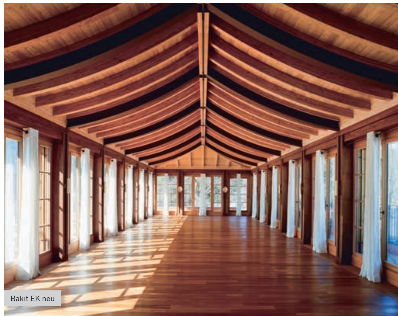
Bakit EK neu